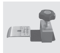
アシストペダル (例)