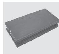
足台 (例) 【出場者・付添者にてご持参ください】